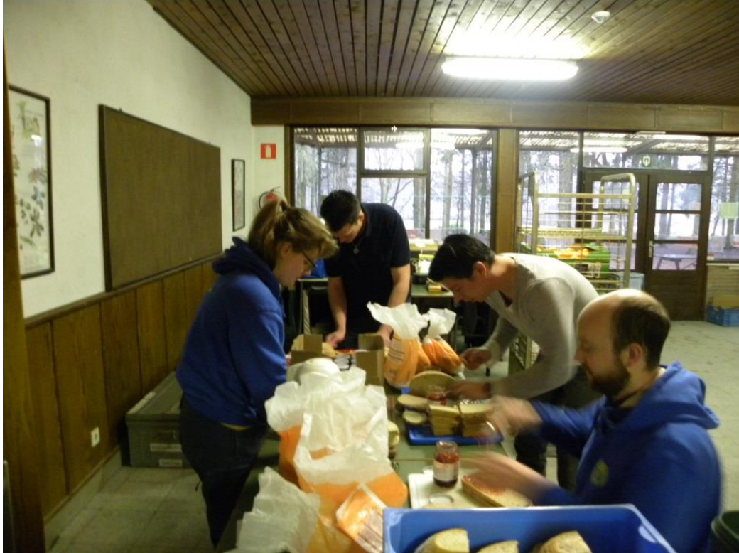
'S morgens en 's avonds boterhammen smeren. Hinde, Grizzly, Saki, Lama