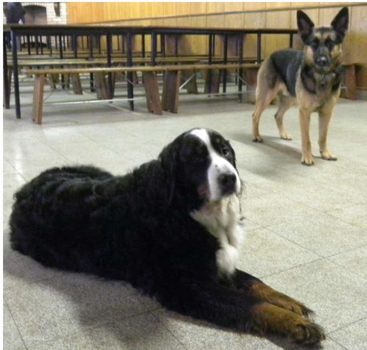
De mascottes: Aiko en Wolf