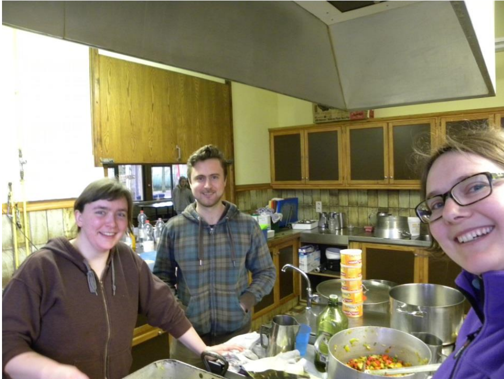
Kongoni geeft de fakkel over aan Cataras en Albatros.