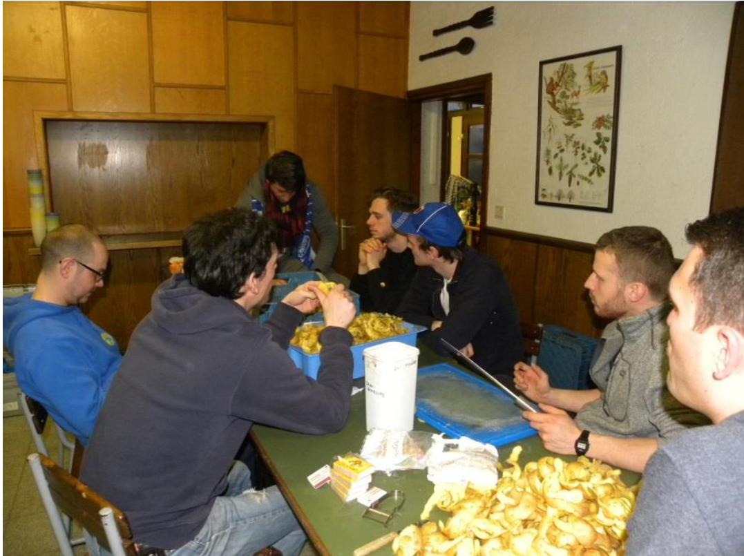
Mannenploeg: Guppy, Saki, Valk, Panter, Leeuw, Grizzly, Hert. Samen aardappelen schillen voor de eenheid.

De twee broers Hert en Saki : verse groenten snijden voor de soep.